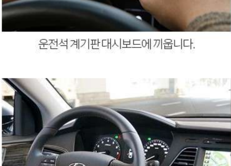
운전석 계기판 대시보드에 끼웁니다.