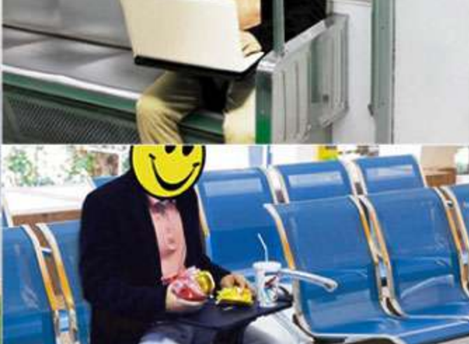
기차, 지하철 대합실 등 장거리 이동시