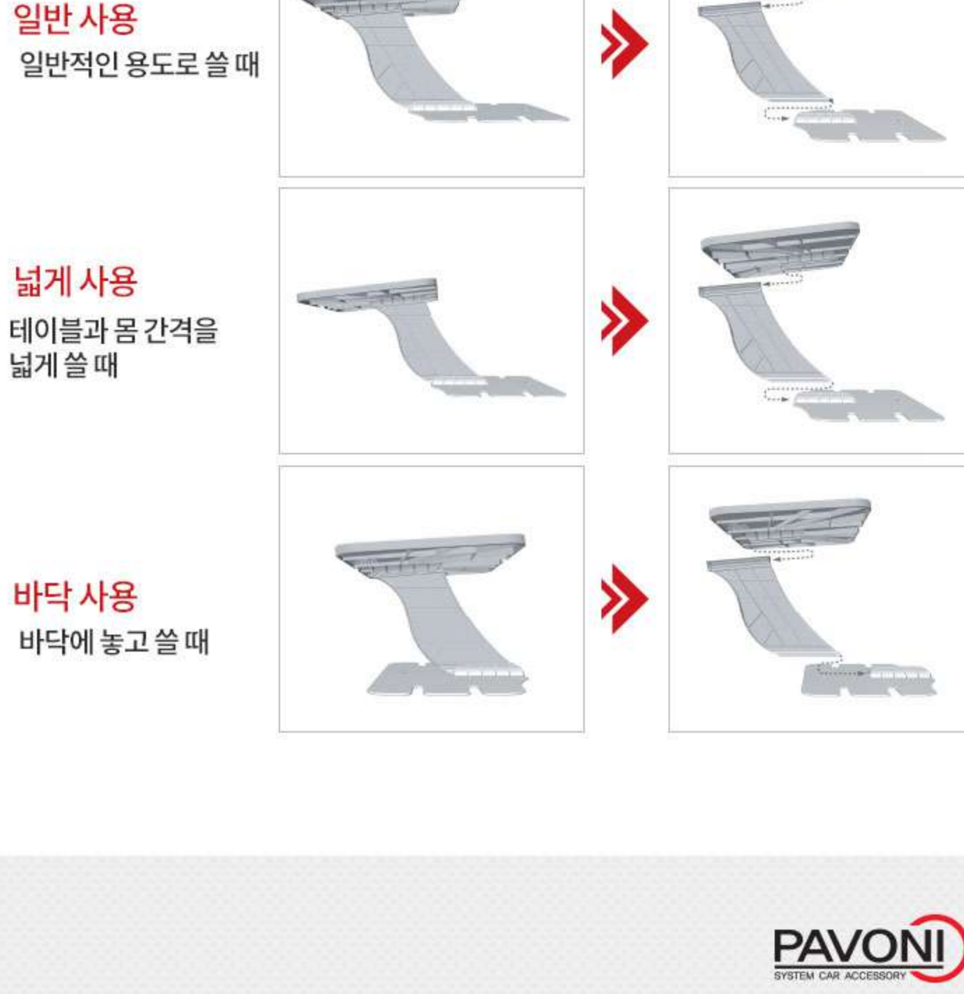
일반 사용 일반적인 용도로 쓸 때