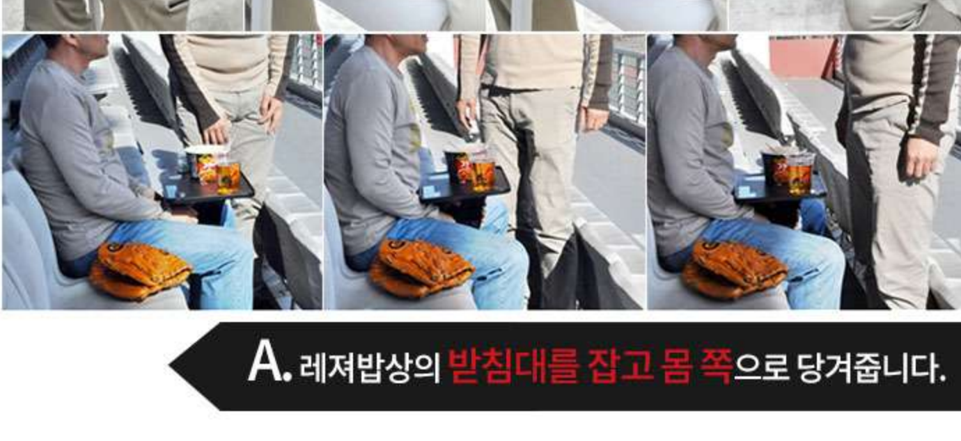
A. 레저밥상의 받침대를 잡고 몸 쪽으로 당겨줍니다.