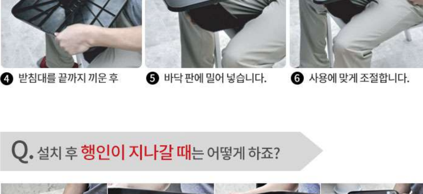
1 바닥판을 의자에 놓습니다. 2 자연스럽게 깔고 앉습니다. 3 받침대를 끼웁니다. 4 받침대를 끝까지 끼운 후 5 바닥 판에 밀어 넣습니다. 6 사용에 맞게 조절합니다.